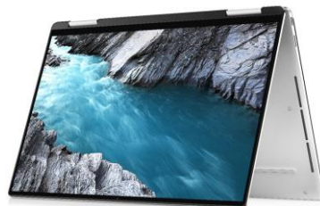
Режим тип „палатка“